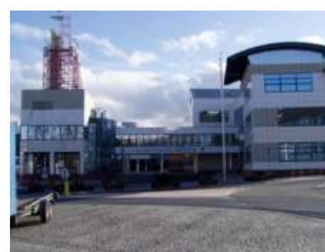
Collegium Polonicum Słubice