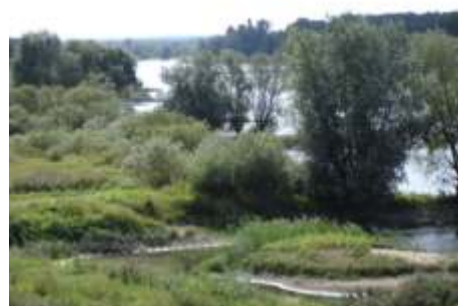
Oderlandschaft bei Cybinka