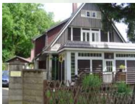
Haus der Naturpflege Bad Freienwalde