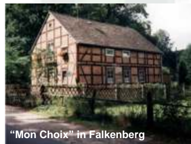
"Mon Choix" in Falkenberg