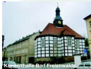
Konzerthalle Bad Freienwalde