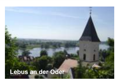
Lebus an der Oder