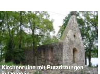
Kirchenruine mit Putzritzungen in Dolgelin