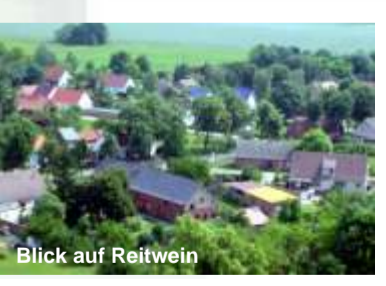
Blick auf Reitwein