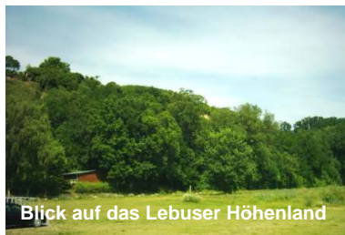
Blick auf das Lebuser Höhenland