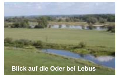
Blick auf die Oder bei Lebus