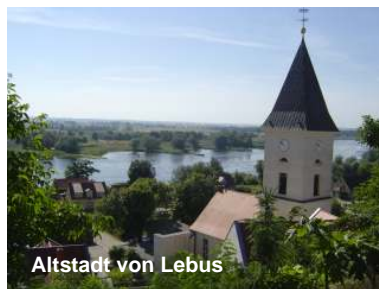
Altstadt von Lebus