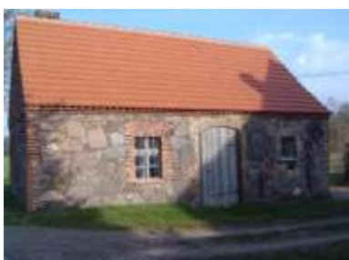
Alte Sensenschmiede Neuentempel