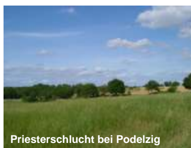
Priesterschlucht bei Podelzig