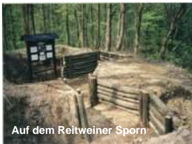
Auf dem Reitweiner Sporn

Kleist-Gedenk- und Forschungsstätte, Galerien, Museen, Kirchen