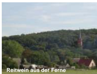
Reitwein aus der Ferne