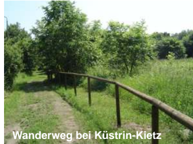
Wanderweg bei Küstrin-Kietz