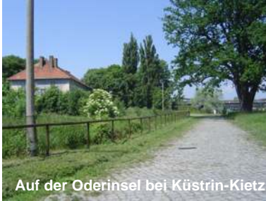
Auf der Oderinsel bei Küstrin-Kietz

Bf. Frankfurt (Oder) - nach Cottbus und Berlin